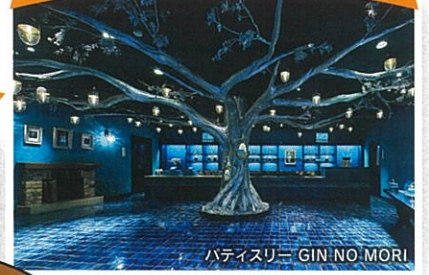
ハテスリー GIN NO MORI